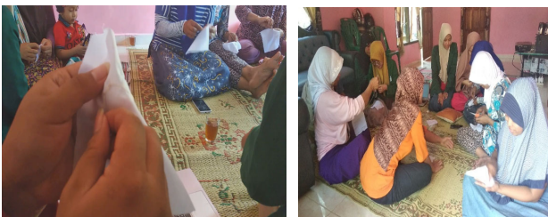
Gambar 4 Proses pengaplikasian jahitan pada pola

Pengaplikasian jahitan pada pola kali ini cukup sulit, dikarenakan beberapa faktor, antara lain: faktor usia ibu-ibu yang berpengaruh pada ketajaman penglihatan, waktu pelatihan yang sempit, rumitnya tusuk variasi, dan kurang sabar dan telatennya ibu-ibu peserta pelatihan sehingga mudah menyerah. Hal tersebut di atas sudah diantisipasi oleh koordinasi pelatih, dengan satu pelatih satu peserta maka kegiatan ini dapat berjalan tepat waktu walaupun bantuan dari pelatih sekitar 40 %.