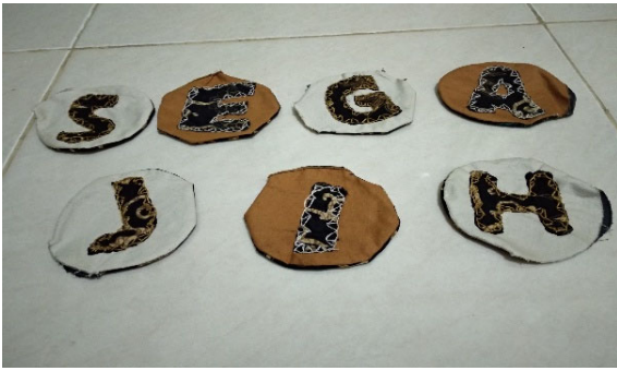
Gambar 3 Hasil pembuatan pola