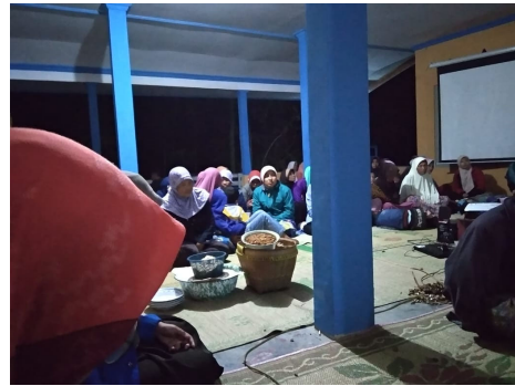
Gambar 3. Suasana pembacaan acara tirakatan

Tirakatan juga menjadi sarana bagaimana masyarakat bisa melakukan gotong royong untuk kepentingan bersama. Sesuai kaidah konformitas (Durkheim, 2011). Masyarakat akan merasa terpanggil jika sesamanya sedang melakukan kerja bakti atau yang lainnya. Mereka dengan kesadaran tanpa ajakan akan membantu. Hal ini juga terjadi pada persiapan tirakatan . Meskipun difasilitasi oleh mahasiswa KKN namun masyarakat juga memiliki inisiatif untuk mengambil peran khususnya dalam segi teknis dan konsumsi. Mereka merasakan bahwa kegiatan ini merupakan tanggung jawab bersama. Meskipun dalam teori dasarnya Emile Durkheim mengatakan tentang repesitas. Namun untuk masyarakat Ngoro-oro bentuk repesitas adalah hukuman dari mulut ke mulut. Jadi, apabila seseorang tidak membantu maka pemuda disana atau masyarakat akan mengatakan di belakang. Hal ini juga dialami oleh peneliti ketika berkumpul dengan pemuda.