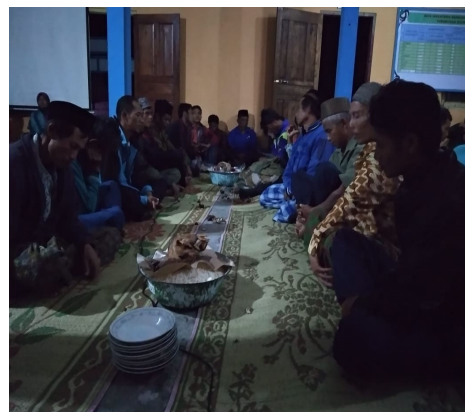
Gambar 4. Suasana makan bersama

Solidaritas menunjukkan puncaknya ketika acara dimulai. Masyarakat betul-betul berada di lokasi sampai acara selesai sekitar pukul 12.00 malam. Bahkan mereka melebur menjadi satu menikmati sajian bersama. Segregasi kelas antara birokratif, tokoh dengan masyarakat melebur menjadi satu tanpa adanya sekat. Dengan piring yang sama yaitu daun jati menyimbolkan seperti pembacaan Boerdiau (2010: 23-21) bahwasanya simbol dari makan bersama adalah kebersamaan dari masyarakat desa. Juga sebagai penguat identitas asli bahwasanya tirakatan adalah sarana untuk melestarikan budaya yang ada desa. Simbolitas lainnya adalah juga bahwasanya solidaritas yang ada di Desa merupakan sesuatu yang tidak akan pernah terlepas. Dimana akan membedakan dengan solidaritas di kota yang berbentuk kepentingan yang berorientasi keuntungan.