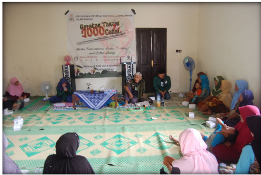
Gambar 2 Kegiatan Penyuluhan Pertanian Gerakan tanam Cabai dan Pengelolaan sampah)

Penyukuhan ini berfokus pada tanaman cabai, dimana cabai merupakan salah satu tanaman dengan harga yang relative tinggi sehingga dengan adanya gerakan tanam cabai khususnya dan tanaman sayuran lain di pekarangan, akan membantu memberikan solusi terhadap permasalahan kecukupan kebutuhan sayuran keluarga. Sekaligus membantu menekan angka inflasi harga cabai tersebut karena Cabai merupakan penyumbang inflasi tertinggi dari 10 komoditas penting di Indonesia.