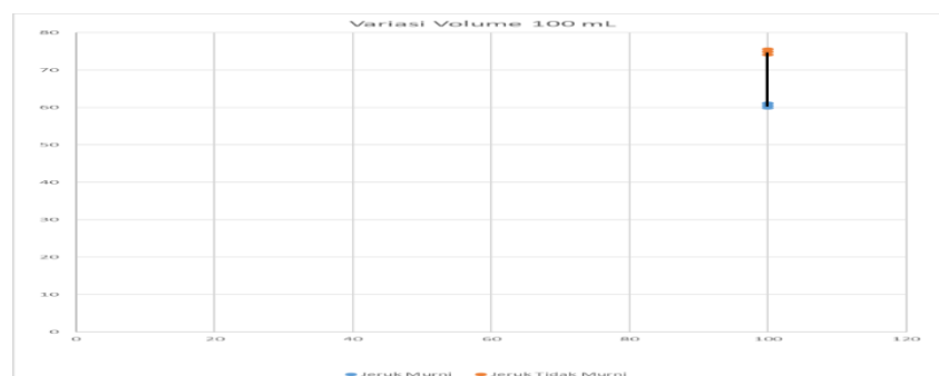
1.b. grafik variasi volume 100ml