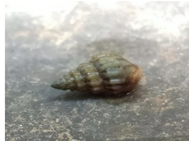
Gambar 7. Thiara scabra

memiliki apeks tumpul dengan lekuk sifon sempit dan meruncing (Viza, 2018).