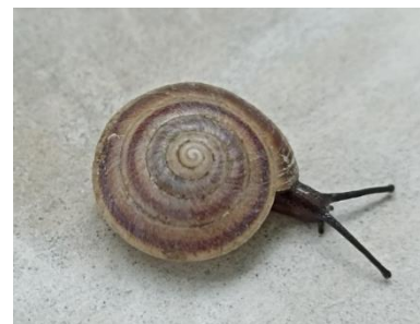
Gambar 3. Geotrochus bicolour

c. Geotrochus bicolor , memiliki cangkang berbentuk kerucut rendah, dengan apex (puncak) yang tumpul. Memiliki warna kuning atau coklat muda dengan zona spiral kastanye di atas dan di bawah pinggiran (GBIF Secretariat, 2021).