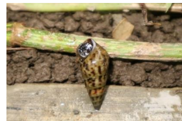
Gambar 8. Sulcospira testudinaria