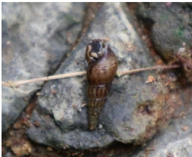
Gambar 5. Melanoides