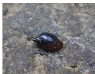
Gambar 9. Radix rubiginosa