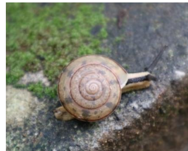
Gambar 2. Elaphroconcha javacencis

b. Elaphroconcha javacencis , memiliki cangkang berbentuk conical pendek dengan bagian tepi cangkang sedikit menyudut, cenderung membulat. Cangkang berwarna coklat muda kekuningan. Pada cangkang terdapat jalur spiral berwarna coklat tua, dan pada wilayah pusat terdapat pula lingkaran coklat tua (Heryanto, 2011).