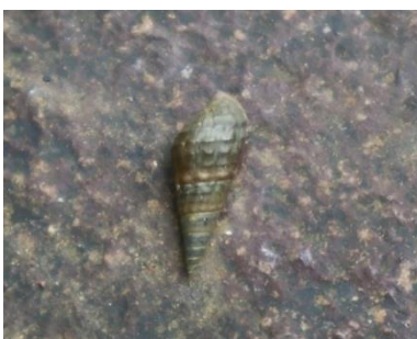
Gambar 6. Tarebia granifera tuberculata