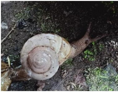
Gambar 4. Hemiplecta humpreysiana