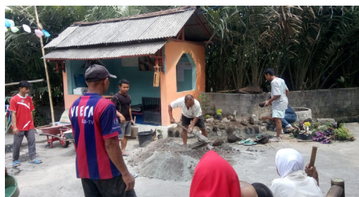
Gambar 2. Gambar Pembuatan Taman

Sepekan kemudian pihak Balai Lingkungan hidup menerima pengajuan proposal dan menyediakan bibit sebanyak 100 pohon Jati, 100 pohon trembesi, dan juga pohon akasia, tidak hanya itu BLH juga menyediakan jenis tanaman hias seperti mawar, pucuk merah, dan lain macam sebagainya. Menurut pihak balai lingkungan hidup, tanaman tersebut biasa digunakan untuk penghijauan dan pelestarian alam. Setelah bibit pohon diambil, warga kemudian bahu membahu menyiapkan prosesi penanaman pohon dan tanaman. Sebagian warga juga memberikan bantuan materiil berupa semen, batu, pupuk dan kebutuhan lainnya untuk menanam pohon. Sedangkan sisanya ada yang mencangkul, dan menyiapkan kubangan lubang untuk menanam pohon.