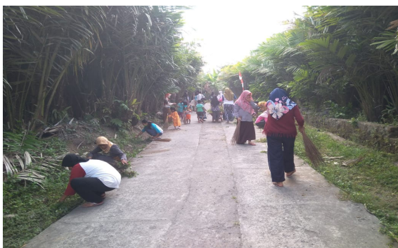
Gambar 1. Aktivitas penanaman pohon

Pelaksanaan yang dilakukan dalam melakukan pelestarian alam, adalah mencari bibit pohon yang bisa di tanam, hal di upayakan adalah membuat proposal dengan meminta bantuan bibit pohon penghijauan, proposal tersebut disebarluaskan kepada instansi-instansi yang menyediakan bibit-bibit tanaman, seperti halnya Balai Lingkungan Hidup dan Dinas Kehutanan Kabupaten Magelang. Menurut Ulin (2014) dalam tulisannya menyebutkan salah satu cara menekan adanya kerusakan alam adalah dengan menanam pohon, pohon dapat menyerap karbondioksida sehingga menjadikan udara menjadi sejuk kembali.