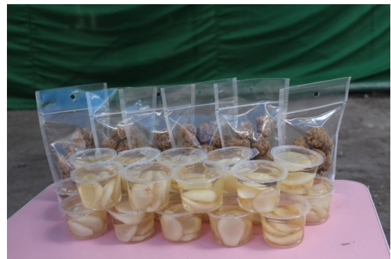
Gambar 8. Geplak salak dan manisan salak