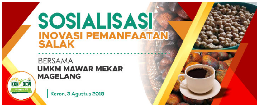
Gambar 4. Desain banner sosialisasi inovasi pemanfaatan salak