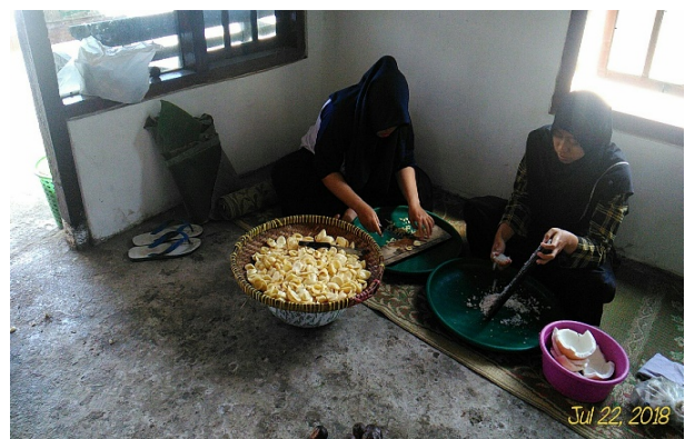
Gambar 2. Membantu pembuatan geplak salak