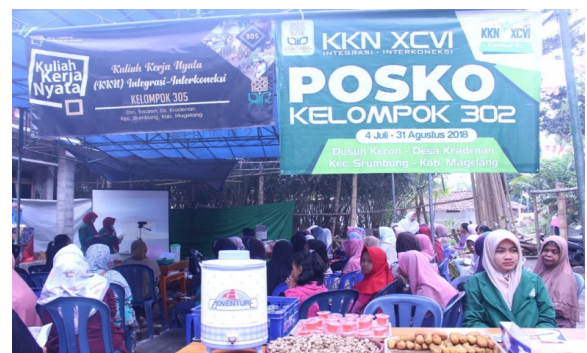
Gambar 10. Suasana sosialisasi inovasi pemanfaatan salak