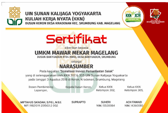
Gambar 5. Desain sertifikat pemateri sosialisasi inovasi pemanfaatan salak