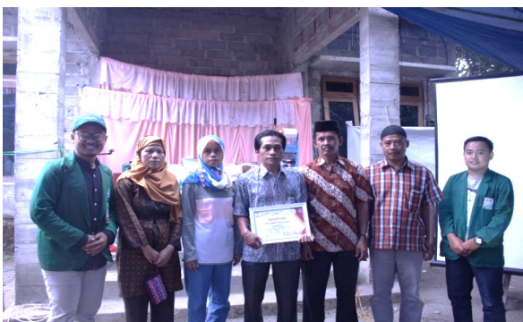
Gambar 6. Penyerahan kenang-kenangan kepada UMKM Mawar Mekar