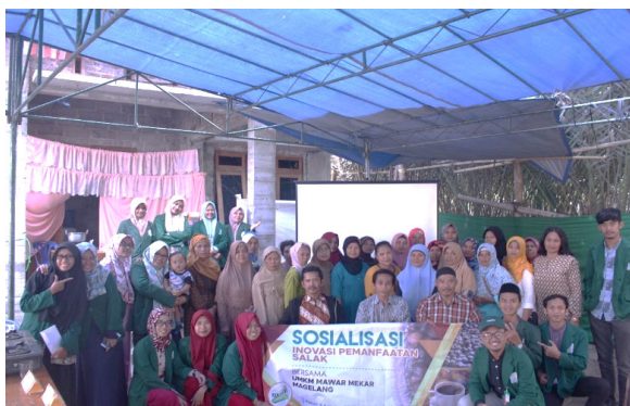
Gambar 7. Foto bersama UMKM Mawar Mekar