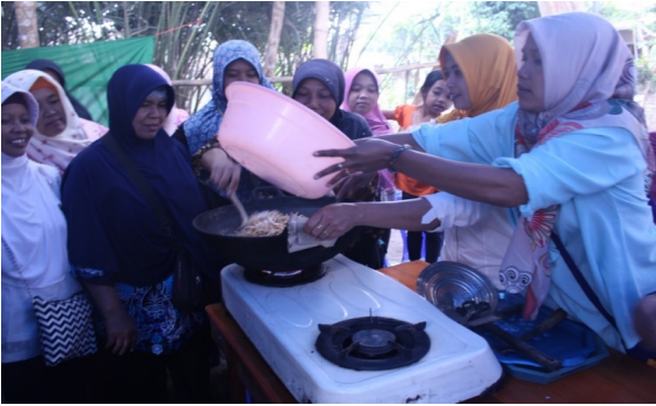
Gambar 11. Suasana praktik pembuatan geplak salak