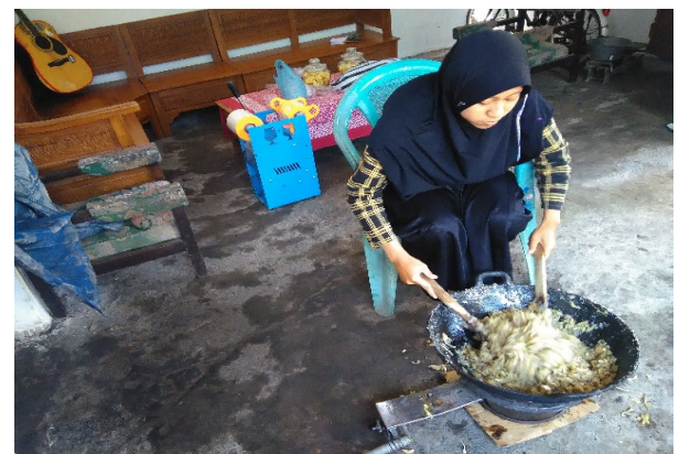
Gambar 3. Percobaan membuat geplak salak