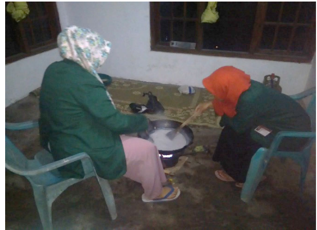
Gambar 1. Praktik percobaan membuat jenang salak

Program sosialisasi inovasi pemanfaatan salak terangkum dalam beberapa dokumentasi berikut: