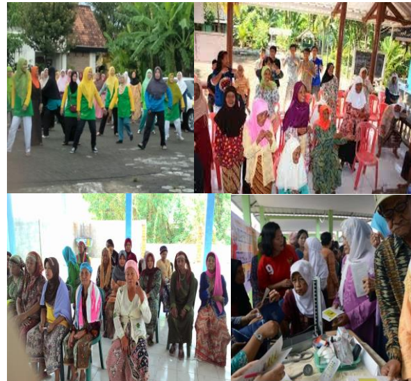
Gambar 2. Kegiatan Pengabdian kepada Masyarakat

Hasil kegiatan berupa pelatihan tentang pengetahuan gizi dan kesehatan pada lansia menunjukkan bahwa pengetahuan peserta dan keterampilannya dalam menyusun menu gizi seimbang mengalami peningkatan yang cukup signifikan setelah diberikan ceramah oleh narasumber yang mumpuni dalam bidangnya, sehingga pada kegiatan tersebut terjadi diskusi yang sangat menarik. Peningkatan pengetahuan tentang masalah gizi dan kesehatan lansia menjadi semakin bertambah atau meningkat setelah diberikan ceramah dan dilanjutkan dengan diskusi.