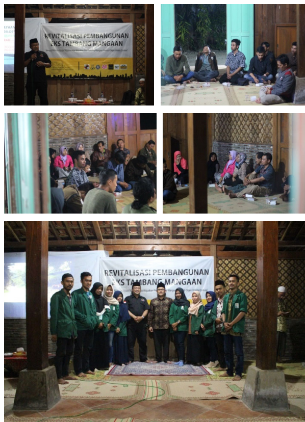
Gambar 1. Dokumentasi kegiatan penyuluhan bertema “Revitalisasi Pembangunan Eks Tambang Mangan”